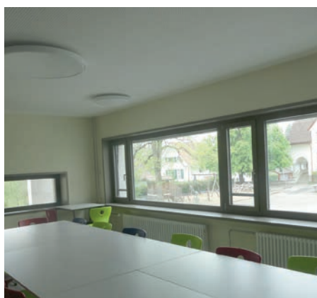
Vom Teamzimmer aus hat man den totalen Überblick.