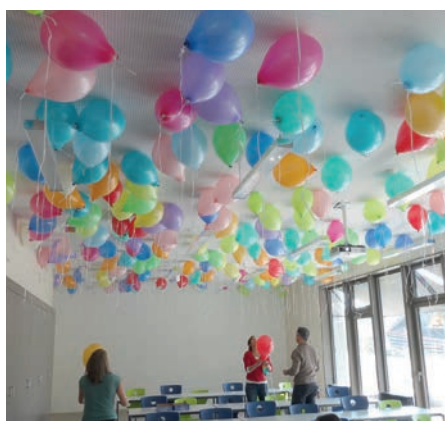
Die Ballone sind bereit zum Abholen.